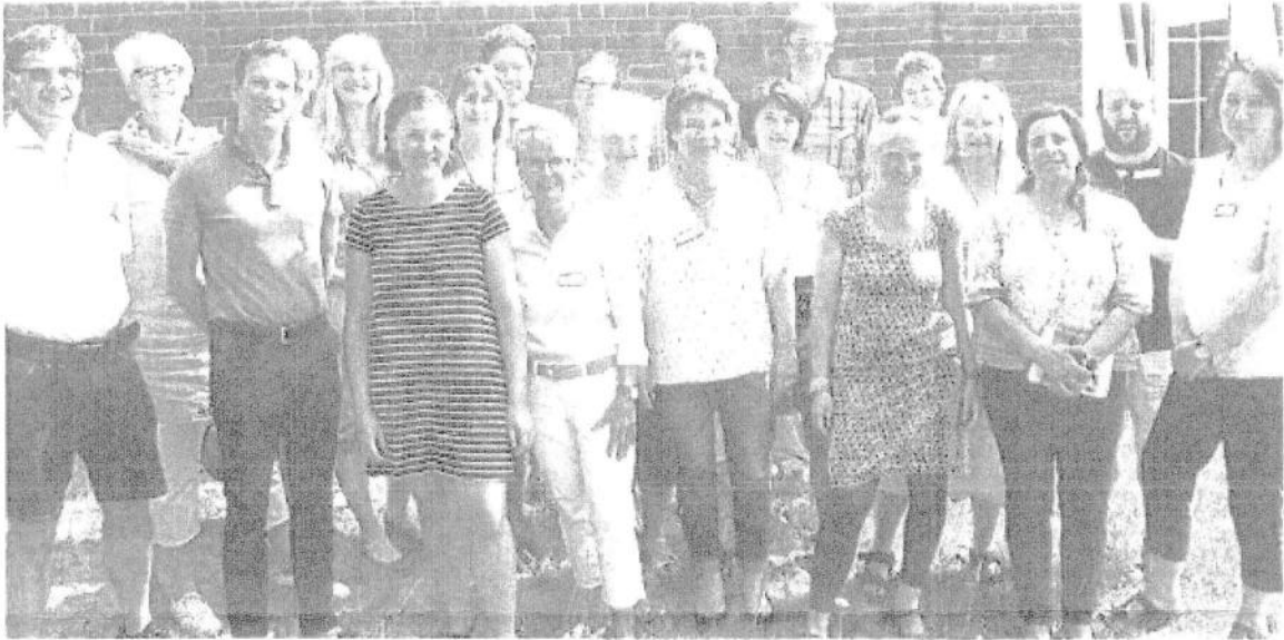
Welche Angebote für Familien gibt es? Was fehlt? Rund 20 Experten folgten der Einladung des DRK und diskutierten über das geplante Familienzentrum.